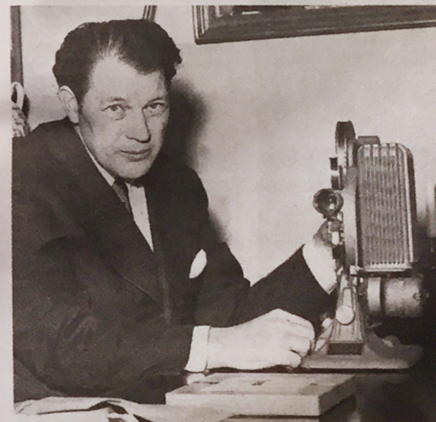
Harry Martinson med filmprojektor i hemmet i Gnesta 1954.