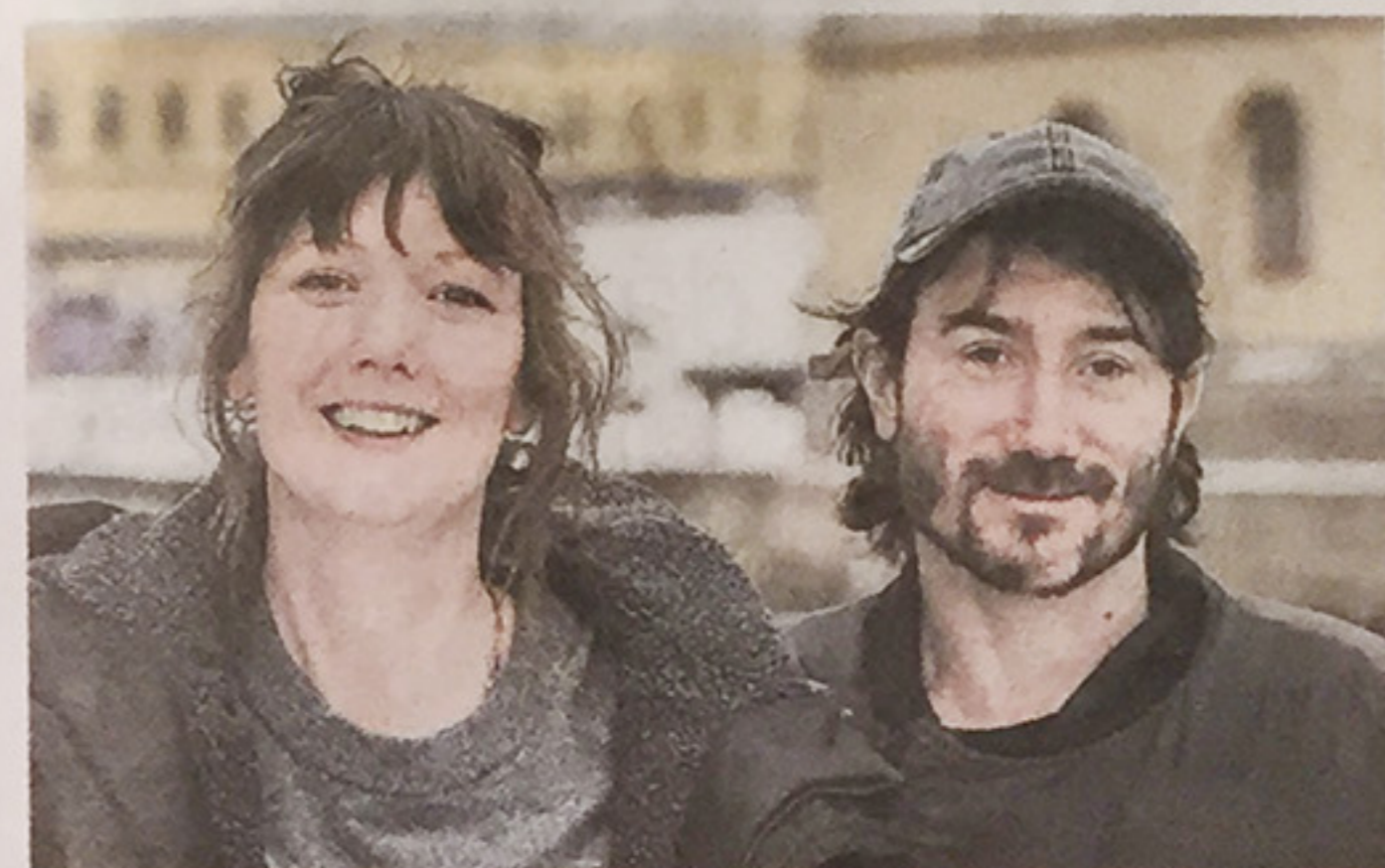
Pella Kågerman och Hugo Lilja har gjort filmen "Aniara".

på ett olyckligt och omotiverat vis förbindelsen mellan mimaroben och den kvinnliga piloten, Isagel, från att ha karaktären av ett för hela verket typiskt uttryck för ett kompensatoriskt begär och en sinnlig men solenn fascination, till en nickande igenkännbar lesbisk kliché. Allt är naturligtvis tillåtet, om den